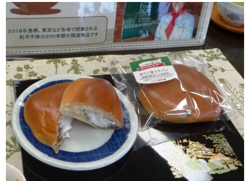
昨年のコンテストの応募作品「ほうじ茶ラテパン」

E-mail：tokusan@city.matsue.lg.jp ホームページ：http://www.matsue-renkei.jp